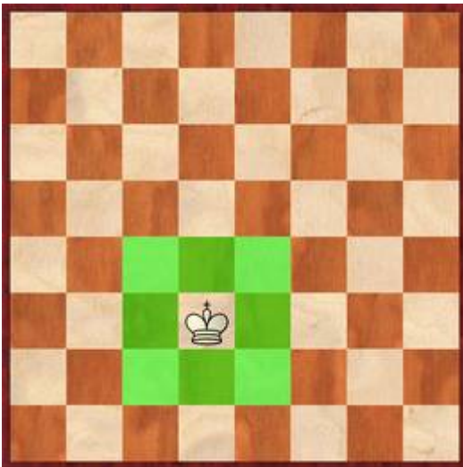
Der König darf auf alle grünen Felder ziehen.

Der König ist die wichtigste Figur. Er kann in alle Richtungen ziehen, aber nur 1 Feld weit. Wird er angegriffen, nennt man das Schach geben . Kann er dann nichts mehr machen und würde im nächsten Zug geschlagen, nennt man das Schachmatt oder Matt . Dann ist die Schachpartie zu Ende. Der König braucht nicht mehr geschlagen werden.